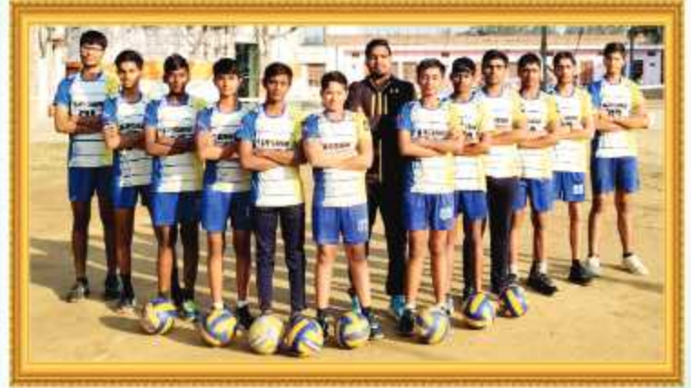
वॉलीबॉल खेल नर्सरी