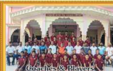
Coaches & Players