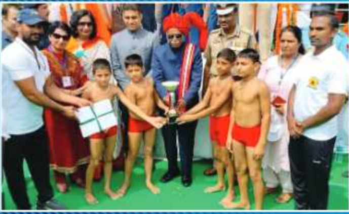
राज्यपाल महोदय के द्वारा पुरस्कृत गुरुकुल के विद्यार्थी