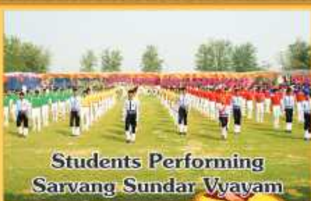
Students Performing Sarvang Sundar Vyayam