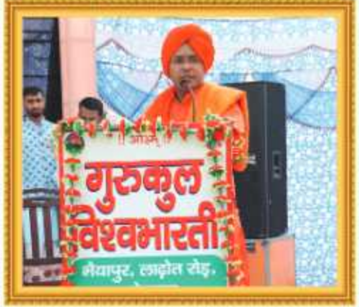
स्वामी आदित्यवेश जी