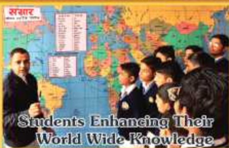
Students Enhancing Their World Wide Knowledge