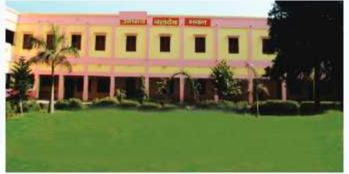
बलदेव भवन छात्रावास ( कक्षा 7वीं, 8वीं )