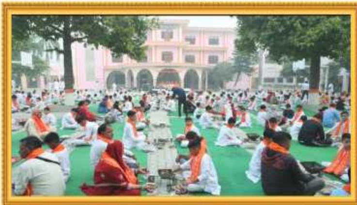
स्वामी दयानन्द सरस्वती जी के 200वीं जयंती के उपलक्ष्य में आयोजित 200 कुंडीय यज्ञ