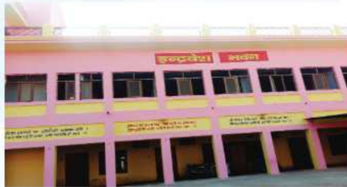
इन्द्रवेश भवन छात्रावास ( कक्षा 5वीं, 6वीं )