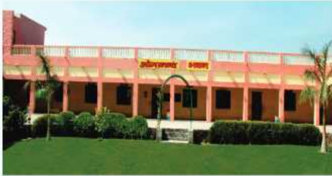
ओमानन्द भवन छात्रावास ( कक्षा 9वीं, 10वीं )