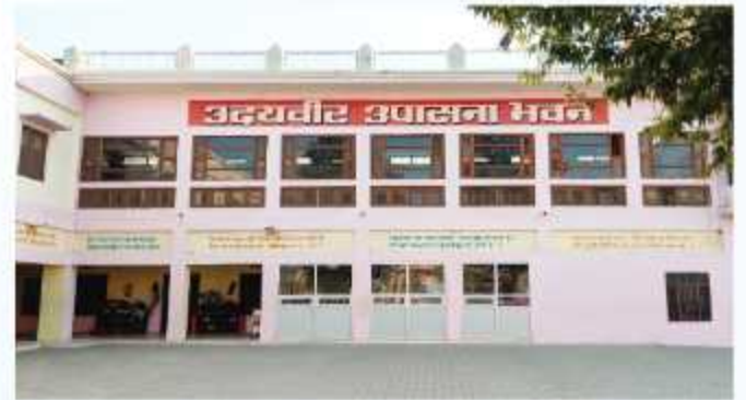
उदयवीर उपासना भवन छात्रावास ( सामूहिक संध्या हवन हेतु )