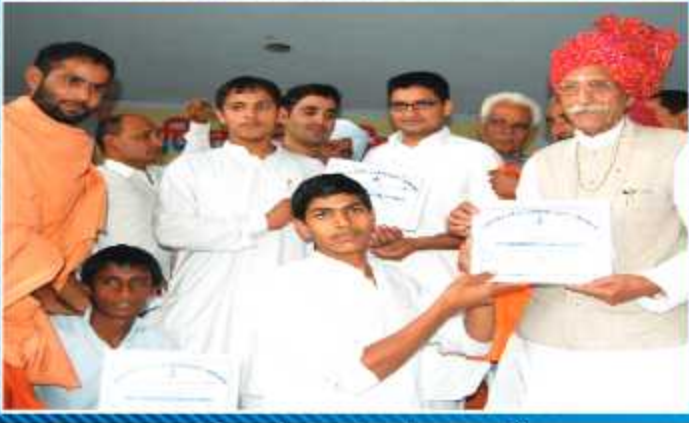
स्व० महाशय धर्मपाल जी (एमडीएच) द्वारा छात्रों का सम्मान