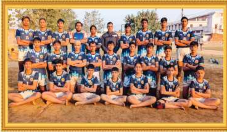
कबड्डी खेल नर्सरी