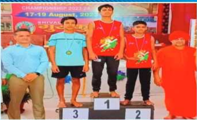
मलखम्ब प्रतियोगिता में प्रथम स्थान प्राप्त करते हुए गुरुकुल के विद्यार्थी