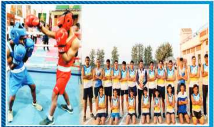
बॉक्सिंग / धावक टीम