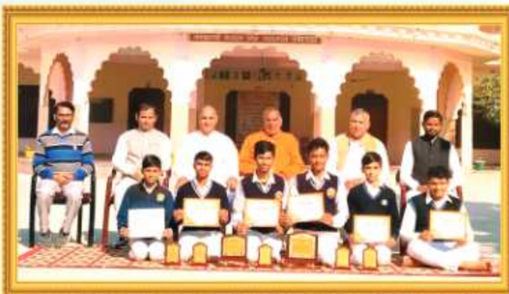
गीता जयन्ती महोत्सव के अवसर पर विभिन्न प्रतियोगिताओं में पुरुस्कृत छात्र