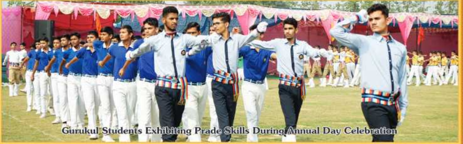
Gurukul Students Exhibiting Prade Skills During Annual Day Celebration