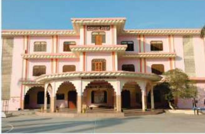
दयानन्द भवन छात्रावास ( कक्षा 11वीं, 12वीं )

विशाल छात्रावास के कमरे हवादार हैं। सभी कमरों में पर्याप्त संख्या में बिस्तर और अलमारी हैं। हर मॉजल में हाइजीनिक वॉशरूम और ऋतु अनुकूल पीने योग्य स्वच्छ जल R.O. की सुविधा है।