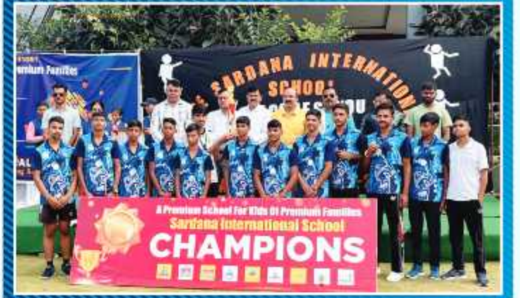
राष्ट्रीय स्तर पर खो-खो प्रतियोगिता में गुरुकुल टीम का द्वितीय स्थान