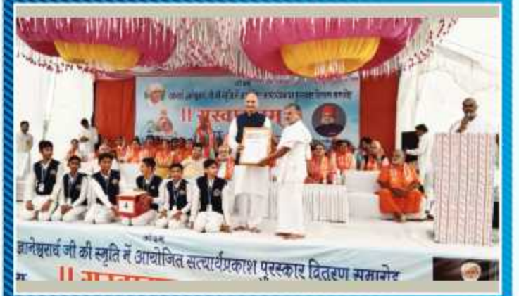
आचार्य ज्ञानेश्वरजी की स्मृति में आयोजित कार्यक्रम में निदेशक महोदय जी का सम्मान