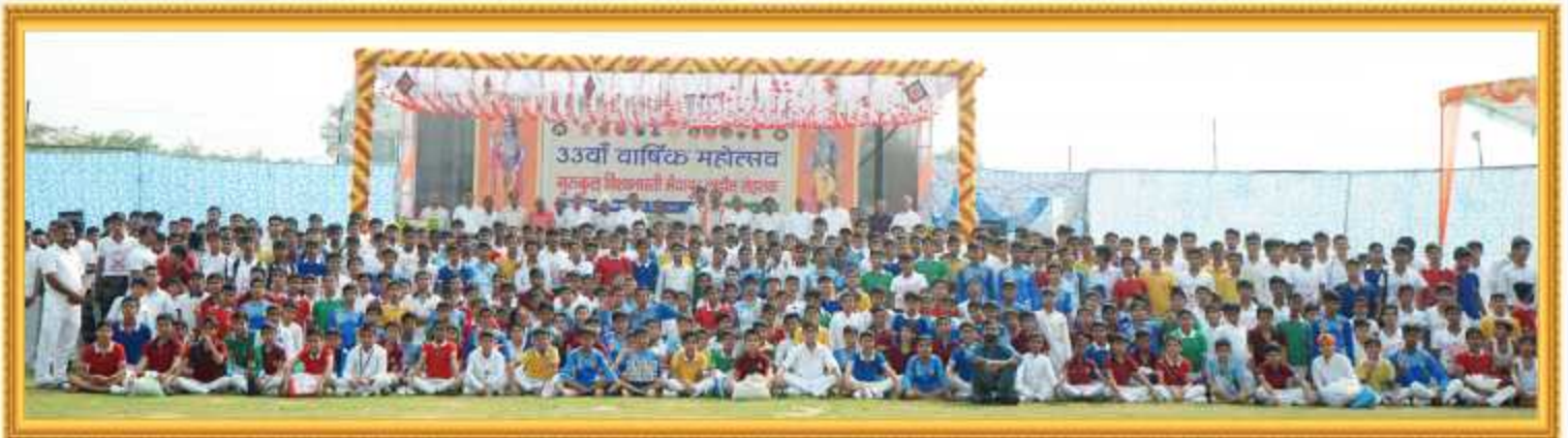
गुरुकुल विश्वभारती भैयापुर लाडौत रोड रोहतक के विद्यार्थी, अधिकारी एवं अध्यापकगण