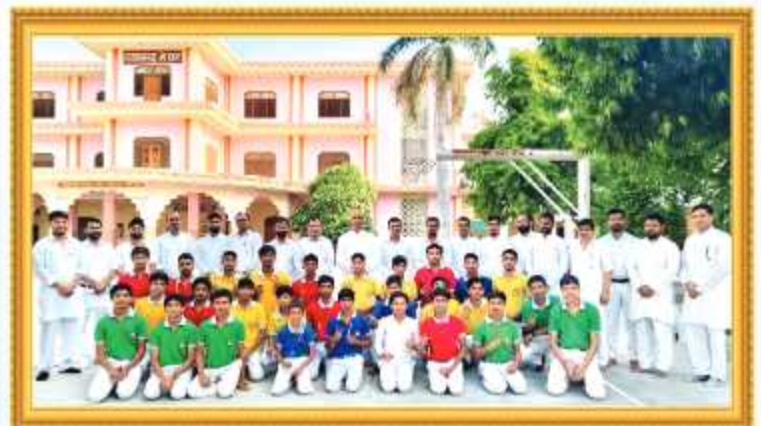
गुरुकुल की विभिन्न दैनिक गतिविधियों में सम्मानित छात्र