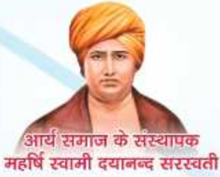
आर्य समाज के संस्थापक महर्षि स्वामी दयानन्द सरस्वती

(प्राचीन व आधुनिक शिक्षा का उत्तम समन्वय)