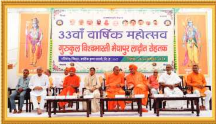
33 वाँ वार्षिक महोत्सव, गुरुकुल विश्वभारती