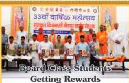
Board Class Students Getting Rewards