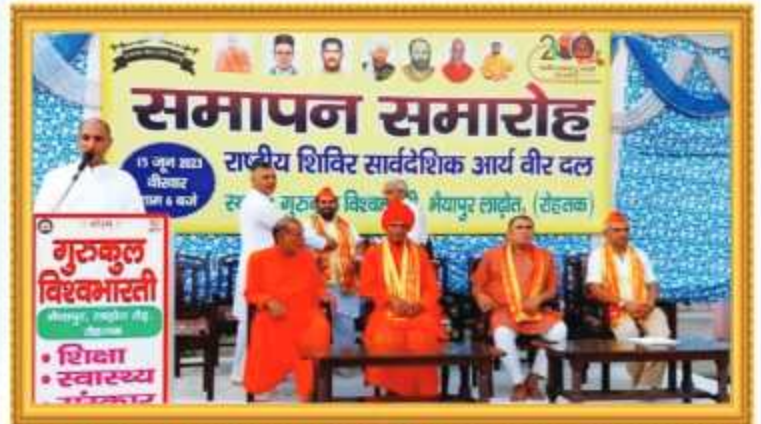
सार्वदेशिक आर्य वीर दल समापन समारोह में आचार्य जी का उद्बोधन