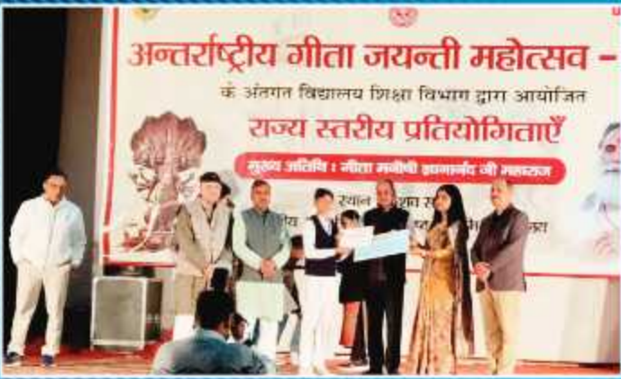
राज्यस्तरीय श्लोक उच्चारण प्रतियोगिता में द्वितीय स्थान